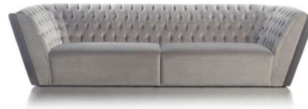
Sofá BOWIE de COLECCIÓN ALEXANDRA Studi. (Salone del Mobile - Milán 2016)