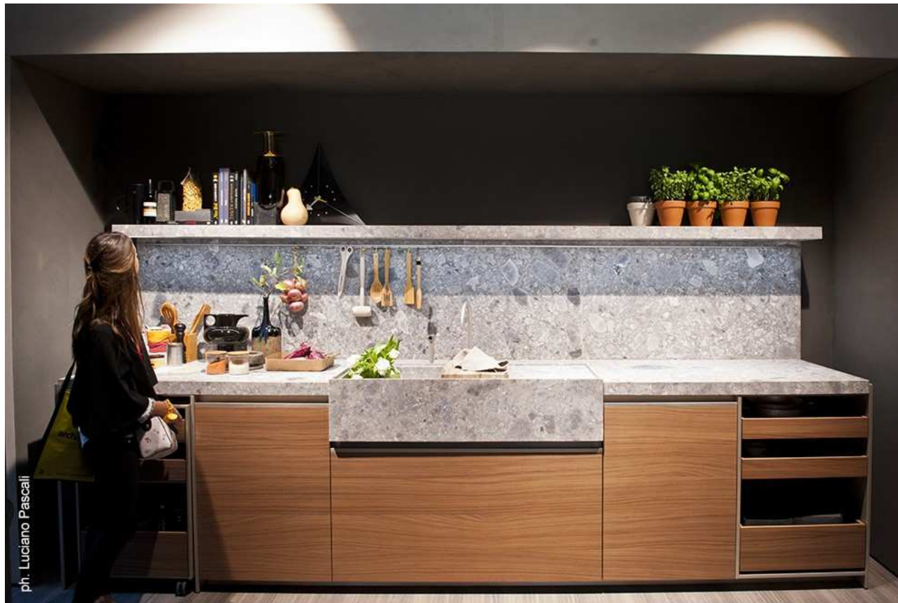
Dada Kitchens (EuroCucina 2016)

Maderas oscuras, en tonos claros, rojizos, anaranjados... La madera, material cálido por excelencia con el que se consiguen espacios confortables y acogedores.