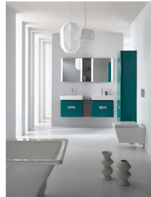
Colección Rêve, de Jacob Delafon.