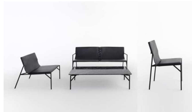
“Tout le Jour” Collection. (Salone del Mobile - Milán 2016)