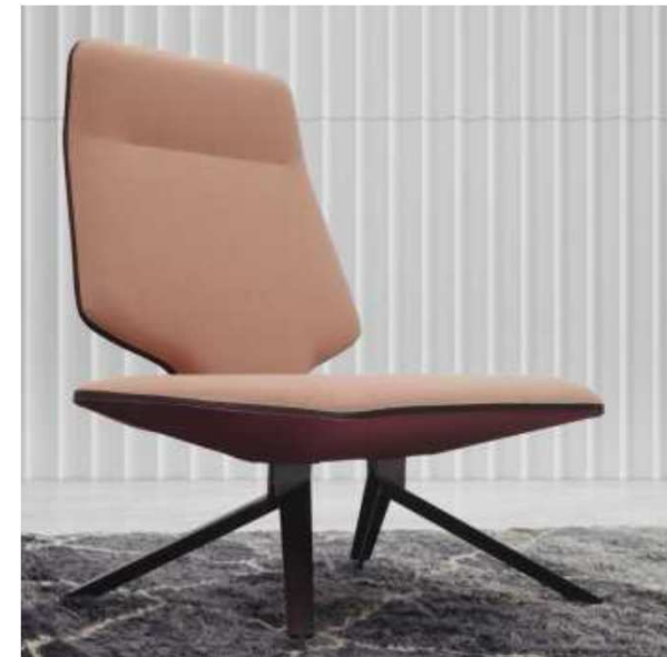
TT Soft para ALIAS.