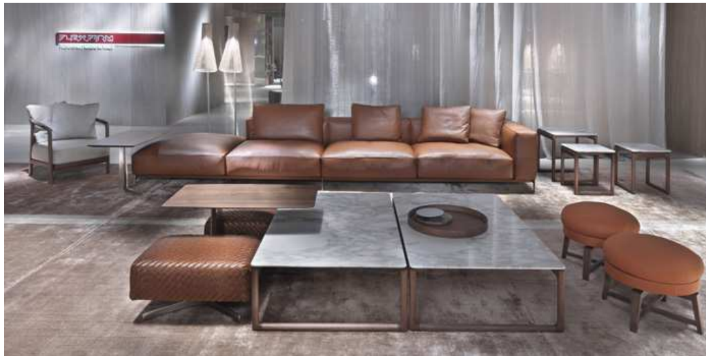
Stand de Flexform. (Salone del Mobile - Milán 2016)

Apuesta por este material tan noble, en todas sus versiones, desde cuero envejecido para crear aspecto Vintage, hasta cuero curtido y tintado.