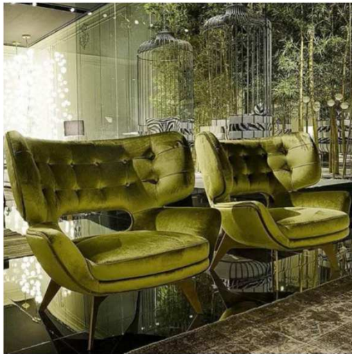
Sillón en terciopelo Roberto Cavalli. (Salone del Mobile - Milán 2016)

Uno de los materiales tendencia para el mueble tapizado en 2016/2017. Todos se visten de terciopelo en una gran variedad de colores.