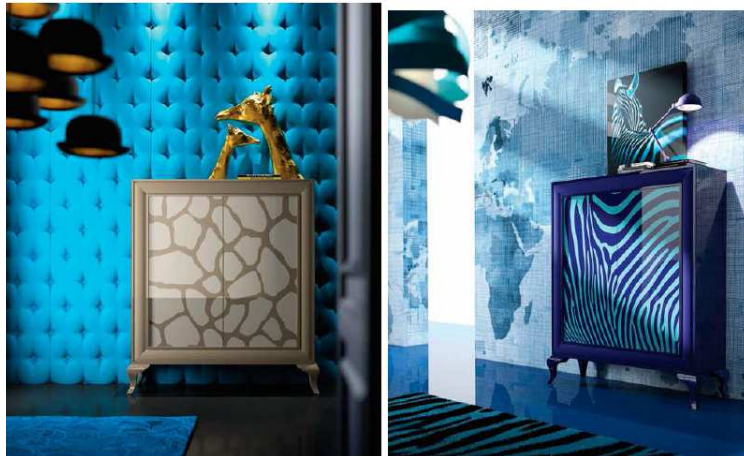
Colección Pluie de couleurs . La Ebanistería. (Salone del Mobile - Milán 2016)