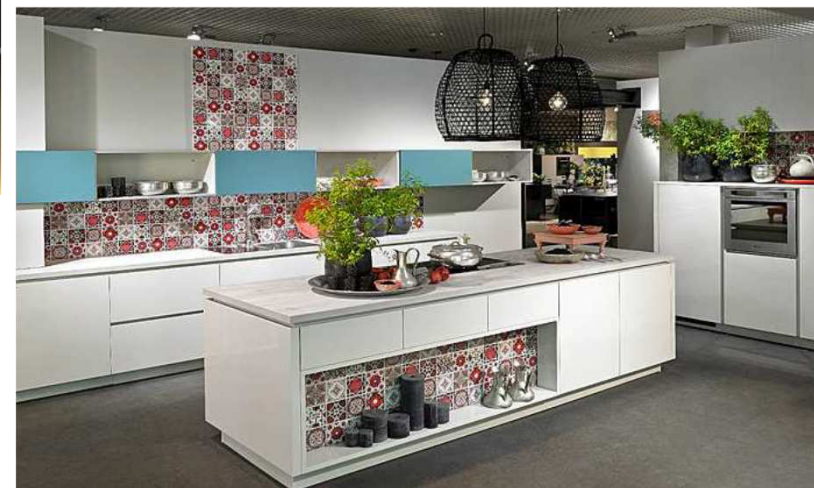
Kitchen by ALNO