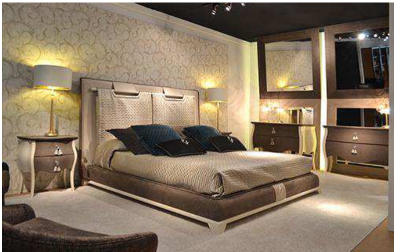
Dormitorio Fortune. Tecni Nova (Salone del Mobile - Milán 2016)