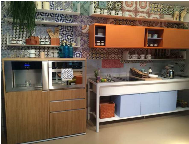
Estel Group plays up the concept of Coffice (EuroCucina 2016)

Los papeles pintados se mezclan con estampados geométricos en las cortinas o suelos de varios materiales distintos. Combinación de elementos clásicos, como las baldosas hidráulicas, con muebles de estilo moderno o con lámparas minimalistas dándole personalidad.