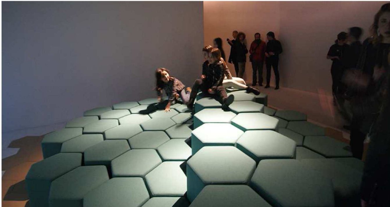
Sistema Lift-Bit de Carlo Ratti y Vitra (Salone del Mobile - Milán 2016)

Múltiples módulos ajustables en altura que dotan de diferentes formas adaptables a las necesidades de su dueño en unos pocos segundos. Cada módulo tiene en su interior una serie de actuadores que elevan o hacen descender la parte superior acolchada.