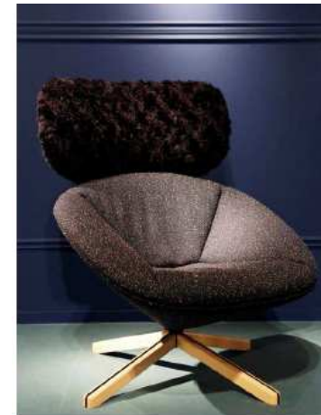
Butaca Tortuga Nadadora. Sancal (Salone del Mobile - Milán 2016)

Clásico estampado en espiga y con pelo, que en su versión más tradicional o en otra más brillante y modernizada tapiza sillones, sillas y pufs.