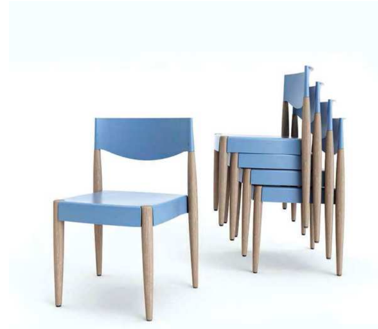
Virna (Mario Mazzer). Alma Design