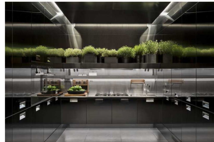
Arclinea (EuroCucina 2016)