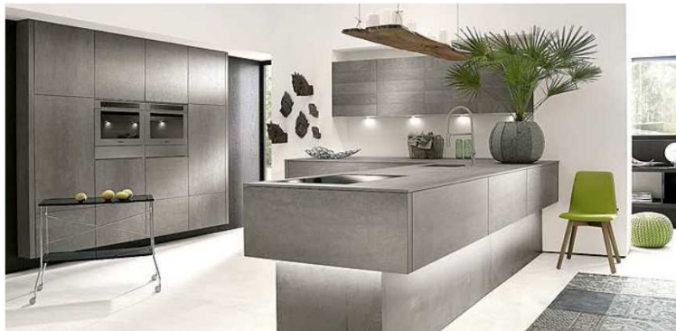
Alnocera Concretto (ganador en el German DesignAward 2016)