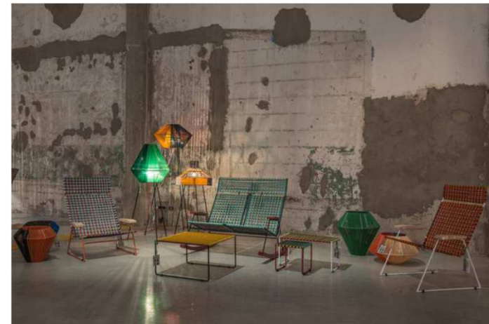
Marni Ballhaus. (Salone del Mobile - Milán 2016)