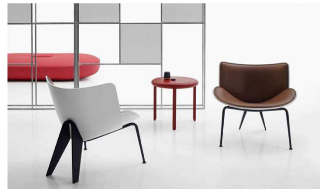
Butaca Do-Maru by Doshi Levien B&B Italia. (Salone del Mobile - Milán 2016)