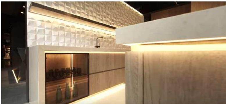
Porcelanosa (EuroCucina 2016)