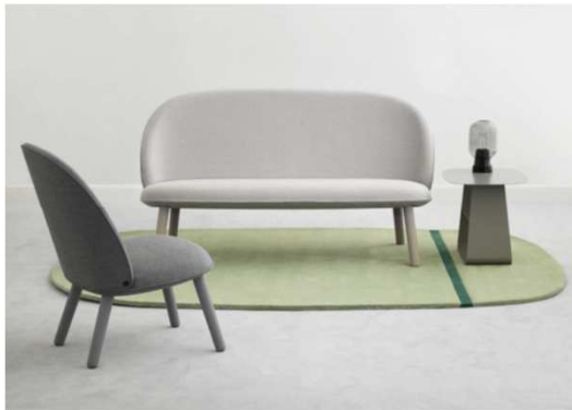
Ace collection (Hans Hornemann). Normann Copenhagen. (Salone del Mobile - Milán 2016)