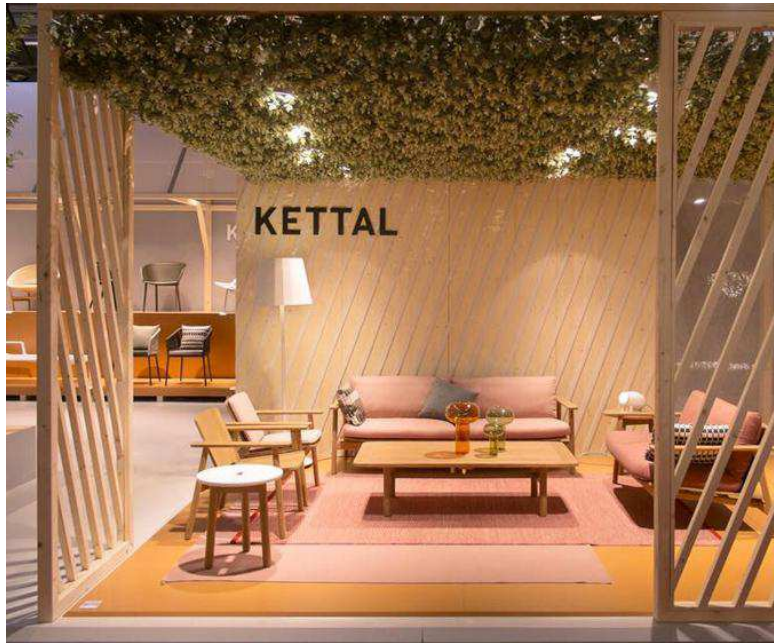
KETTAL (Salone del Mobile - Milán 2016)

La madera sigue brillando en todo su esplendor, especialmente en tonos muy naturales e incluso mimando y cuidando las irregularidades y 'defectos' como las marcas de carcoma.