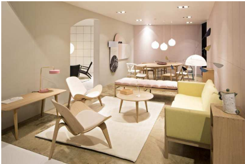
The Carl Hansen & Søn (Salone del Mobile - Milán 2016)