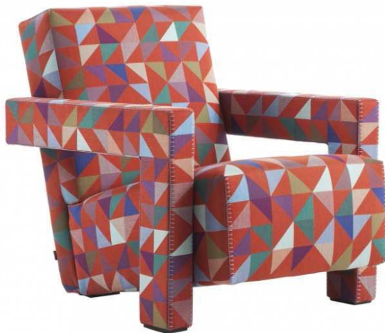
Butaca Utrecht (Gerrit Rietveld), retapizada por Bertjan Pot, Cassina. (Salone del Mobile - Milán 2016)