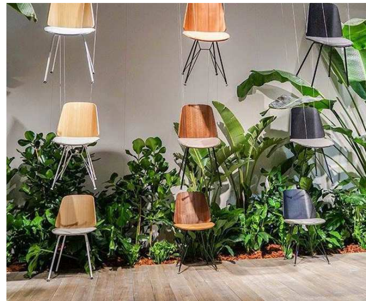
ZANOTTA (Salone del Mobile - Milán 2016)