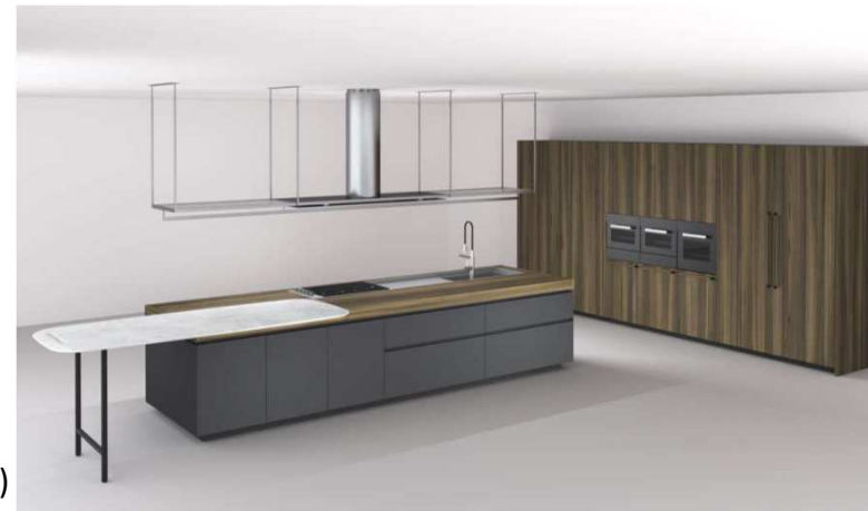
Kitchen Boffi Code (Piero Lissoni)