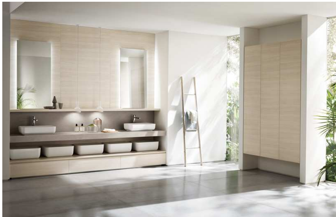
Baño Ki (Diseño: Nendo) Scavolini (2016)

Se las denomina maderas “relajantes” porque tienen menos nudos, su veta está poco marcada y son más dulces y delicadas a la vista. Entre estas maderas encontramos el haya o el fresno. Además, son imitadas a la perfección en los materiales y crean ambientes bonitos y contemporáneos.