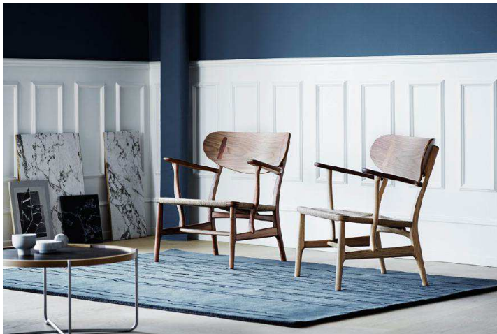
Silla CH22 (Reedición Carl Hansen & Son). Diseño original: Hans J. Wegner (1950)

La nostalgia por los años 50 y 60 ha marcado el diseño del mobiliario de las pasadas temporadas y volverá a hacerlo durante el 2016 y parte del 2017.