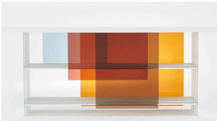
Layers (Nendo). Glas Italia. (Salone del Mobile - Milán 2016)