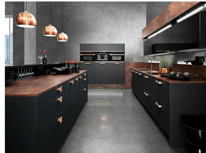
Topaz dark kitchen copper fittings.