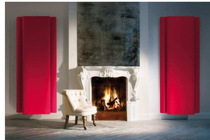
Cortinas Bemolle. Caimi Brevetti. (Salone del Mobile - Milán 2016)

MATERIALES FONOABSORBENTES: cortinas capaces de atenuar la molesta reverberación acústica en los ambientes gracias a la tecnología patentada Snowsound-Fiber basada en suaves fibras de poliéster entrelazadas.