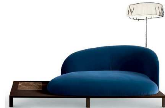
Bonsai by Claesson Koivisto Rune for Arflex (Salone del Mobile - Milán 2016)