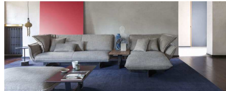
Beam Sofa System (Patricia Urquiola). Cassina. (Salone del Mobile - Milán 2016)