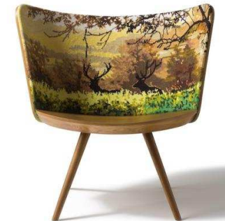
Embroidery Chair series (Johan Lindstèn) Cappellini (Salone del Mobile - Milán 2016)