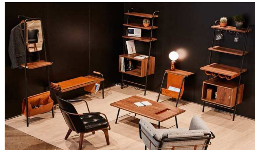
Valet collection (David Rockwell). Stellar Works. (Salone del Mobile - Milán 2016)