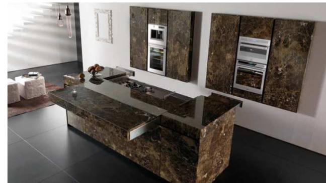
Cocina de Toncelli. (EuroCucina 2016)