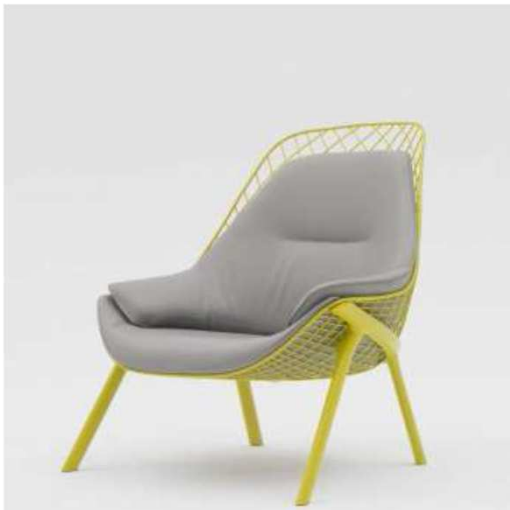
Butaca Gran KOBİ.