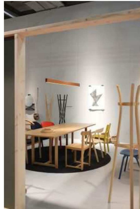
Zilio A&C (Salone del Mobile - Milán 2016)