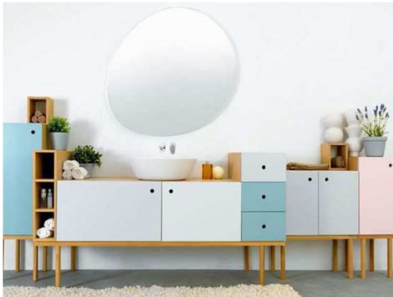
OASIS OF CALM by GROHE (Salone del Mobile - Milán 2016)

Apuesta por el color a través de los muebles, paredes, textiles, adornos o detalles. El cuarto de baño tampoco se escapa a la tendencia del color rosa cuarzo y azul serenity del 2016. Los colores propuestos están inspirados en el deseo de tranquilidad, fuerza y optimismo sin perder elegancia. Capitaneados por la familia del color azul en todas sus gamas (azul serenity, azul petroleo, snorkel blue, etc.) también verdes, amarillos y rosas en un tipo de decoración donde el espacio se convierte en un lienzo en blanco en el que los muebles y objetos son los encargados de darle un toque de color.