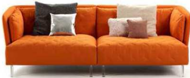
Sofá Obi acolchado de SANCAL. (Salone del Mobile - Milán 2016)