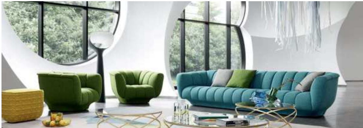
La Roche Bobois.

Las tonalidades predominantes en las Ferias IMM Colonia y Milán 2016 han sido el rosa, el azul, el amarillo y el rojo. El color verde hierba y el azul petróleo (Sofá Bonsai de Arflex), también han sido muy utilizados sobre todo en las propuestas más retro.