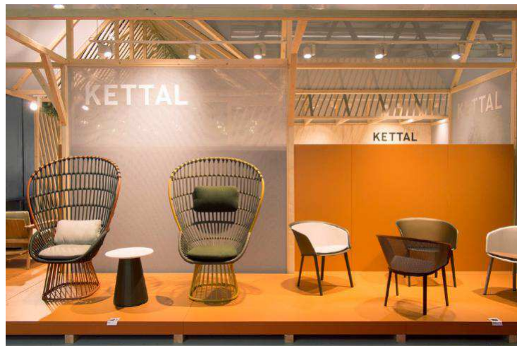
Sillón CALA (Doshi Levien). KETAL. (Salone del Mobile - Milán 2016)